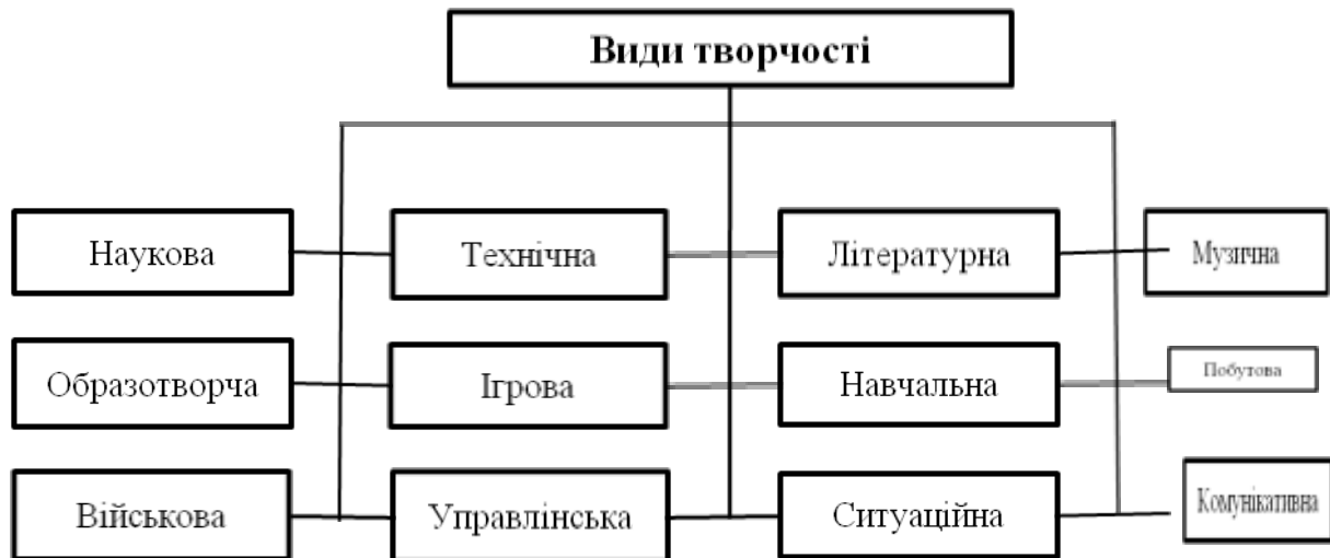
Рис. 1. Види творчості

Наукова творчість пов'язана з діяльністю в певній галузі науки, наприклад хімії, математики. Її специфіка полягає в домінуванні теоретичного мислення, хоча останнім часом найчастіше переважає комбіноване мислення – теоретико-практичне. Можна виділити типове мислення фізика, біолога, математика тощо.