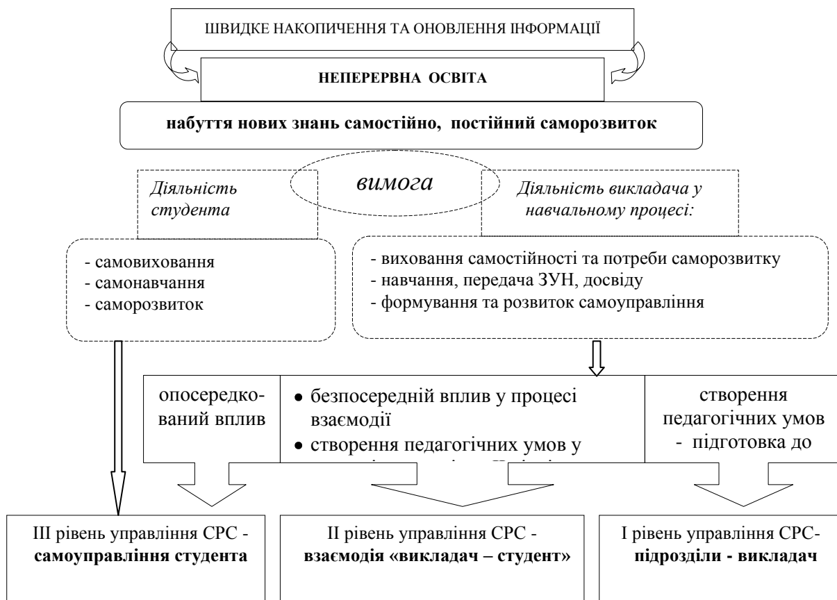
Рис.1. Реалізація вимог до діяльності студента та викладача у процесі формування готовності до неперервної освіти

Для забезпечення результативності та ефективності самоуправління студента при виконанні самостійних навчальних завдань визначальним є вплив викладача, який може бути як безпосереднім у процесі взаємодії, так і опосередкованим через зміст і форми завдань для самостійної роботи та задані терміни її виконання (див. рис.1).