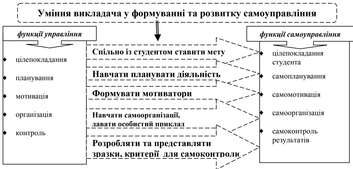
Рис.4. Компетенції викладача для здійснення безпосереднього впливу на самоуправління студента

діяльності. Такий стиль керівництва СРС є допустимим по відношенню до творчих студентів, які відрізняються високим рівнем самостійності та творчою індивідуальністю.