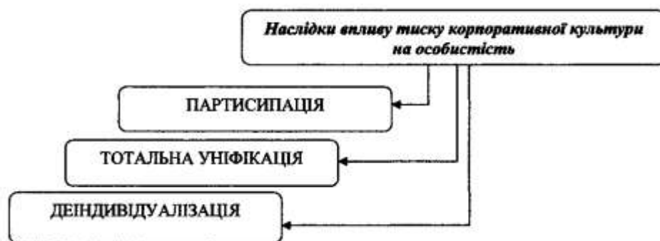
Рис. 3. Наслідки впливу тиску корпоративної культури на особистість

Наслідком максимального тиску позитивного характеру на особистість є партисипація , тобто діяльність конструктивного тиску корпоративної культури. Вона проявляється симбіозом людини та організації. Кожен прагне в максимальній мірі реалізувати індивідуальні здібності для досягнення загальної особистісної значущої для всіх мети. Основна форма роботи – самоврядна команда. Має місце осмислена ефективна взаємодія організації і людини, без розмиття індивідуальності останнього. Виникає позитивний ефект групового мислення – організаційна рефлексія [2, 53], яка в цьому випадку наділяє організацію якісно іншою, істотно більш високою еволюційною ефективністю: механізми мінливості, спадковості і природного добору організаційного середовища переміщуються з об'єктивної реальності у вільно обговорювані і критиковані суб'єктивні конструкції співробітників.