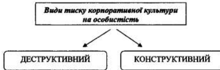
Рис. 2. Види тиску корпоративної культури на особистість

Особистість може і повинна співіснувати і ефективно взаємодіяти з корпоративною культурою при певному вигляді взаємовідносин [3, 23]. Розглянемо кілька видів тиску однієї культури на іншу та культури на особистісний потенціал (рис.2). У повсякденності організації існує як деструктивний тиск, так і конструктивний. Відзначимо, що певний рівень тиску має місце при конкретному типі управління організацією [1, 133-137].